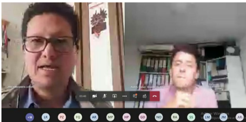
La participación de los jóvenes en la conducción de políticas públicas para el campo garantiza el futuro de los alimentos en las mesas colombianas.

Durante el encuentro juvenil en el que la Red fue representada por