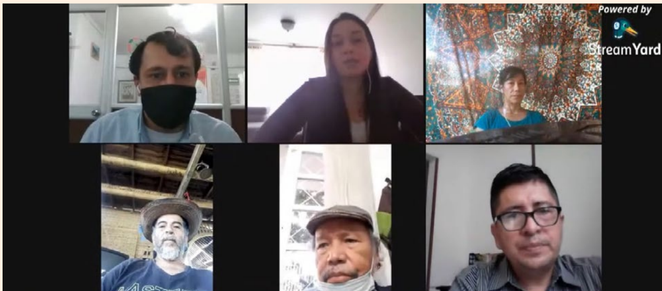
Los circuitos de comercialización cortos han permitido que la alimentación y economías de las familias no se vean afectadas durante la pandemia del covid 19.